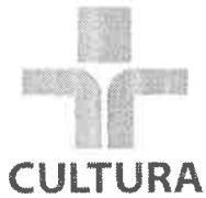
FIG. Nº 95 Proc. Nº 0749/21 Rubrica Aume